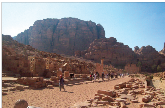
Mózes völgye Jordániában, ahol víz fakadt a sziklából