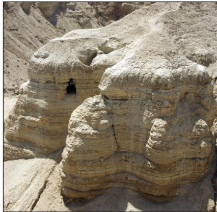
A qumrani sziklabarlangok, ahol a cserépkorszokban őrzött kétezer éves bibliatekercseket 1947-ben megtalálták

Qumran – Jerikótól mintegy 20 kilométerre a Jordán völgyében dél felé haladva kerestük föl az esszénus közösség Holt-tenger partján található, Qumranban kiasott kolostorának romjait. A hajdani település mintegy 330 méterrel fekszik a tengerszint alatt. A Szentírás olvasásával, értelmezésével és másolásával foglalkozó közösség tagja lehetett egyes hittudósok szerint annak idején Bemerítő János is. Meglepő, hogy Ézsaiásnak a Messiás közeli eljövételét hirdető és jövendöléseit naprakészen váró közösség rituális