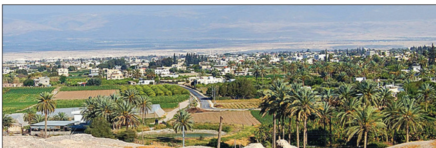
Jerikó, a pálmák városa a Jordán folyó völgyében