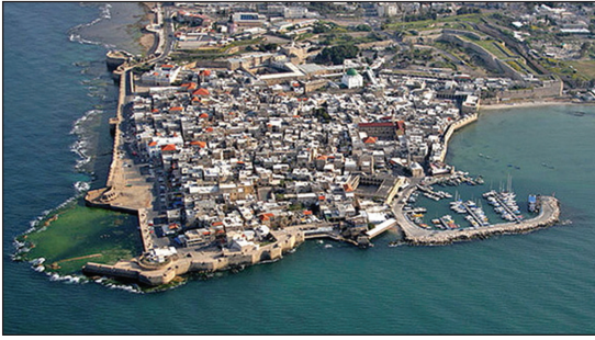
Akko, a keresztes vitézek ősi falakkal védett városa

A Földközi-tenger partvidéke is sok bibliai emlékekkel szolgál. Akko, a valamikori Ptolemais, Pál apostol utazásából ismerős, aki itt is megfordult, és gyülekezet jött létre látogatása nyomán. Sőt, itt kapta az első, de nem utolsó határozott figyelmeztetést, hogy Jeruzsálemben való utazása nem-hogy kockázatos, de egyenesen életveszélyes, hisz ott letartóztatás, börtön, sőt még halálos ítélet is várhat rá. Mire az apostol válasza egy ellentmondást nem tűrő mondat volt: „Még az életem sem drága nekem, csak hogy a futásomat elvégezzem”.