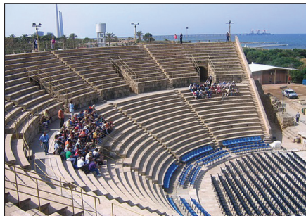
Cézarea római kori amfiteátruma. Ebben a városban merítkezett be Kornéliusz római százados háza népével együtt