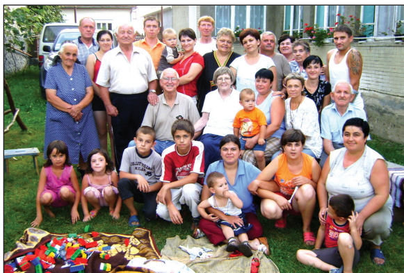
Kárpátaljai, beregújfalui és gáti romák együtt