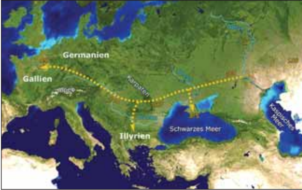
A hunok térhódítása Európában

„Őseinket felhozád...” – folytatás a címloldalról