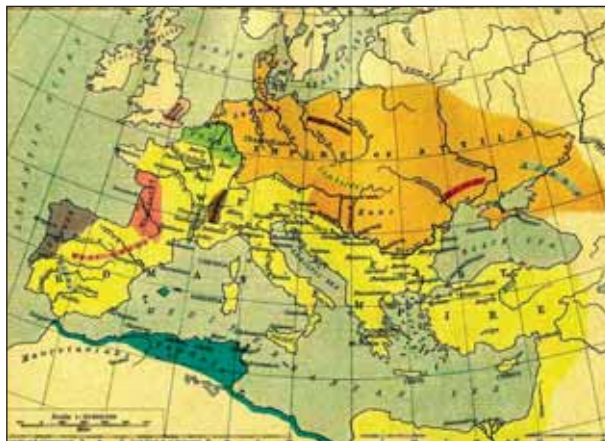
A római és hun birodalom határai 450-ben