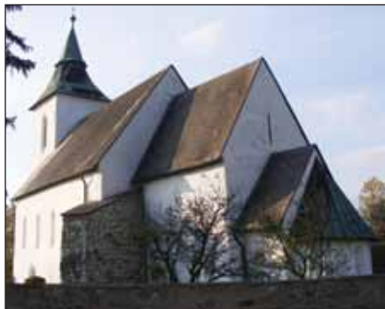
Vizsolyi református templom, a Biblia őrhelye