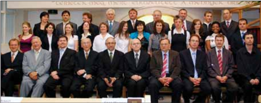
Végzős hallgatók, az oktatók és egyházi vezetők egy csoportja

A megváltottak életének egyik öröme a szolgálati lehetőségek nyitott ajtaja. A kárhozottól Isten Fiának halála által irgalomból megszabadítottak viszontszeretete keresi az alkalmakat. Minden felülről adatott megnyíló lehetőség, legyen az profán vagy kultuszi területre hívó, evangelizáló vagy hitben erősítő, gyermekien egyszerű vagy alig megoldható, szóbeli tanúságtétel vagy fizikai munka, az alázatos szolgáló életek kegyelmi visszaigazolása. Minden nyitott ajtó felelősség: észrevenni, a megbízó akarata szerint kihasználni, hűségesen sáfárkodni vele.