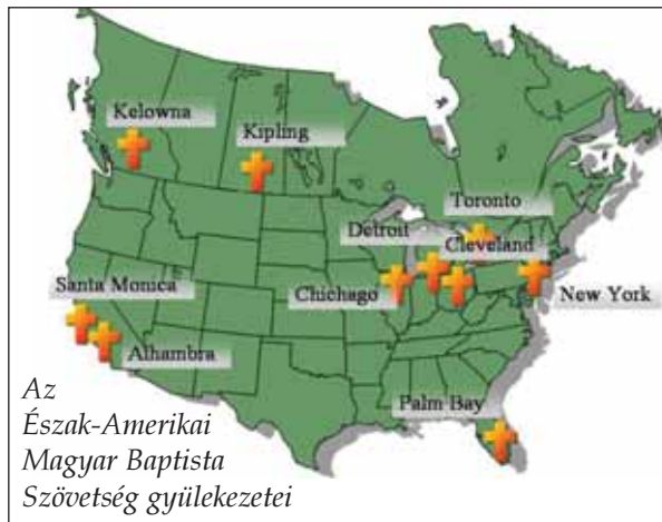
Az Észak-Amerikai Magyar Baptista Szövetség gyülekezetei