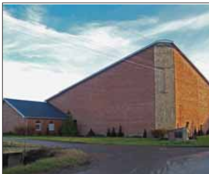
Bácspetrócön a kétezer ülőhelyes amerikai stílusú baptista templomban folytatódott a jubileumi ünneppsorozat

Együtt, egymással ünnepelte meg az európai baptizmus megalakulásának 400 éves jubileumát Újvidéken, advent első vasárnapján a gyülekezet és a magyarországi Baptista Központi Énekkar. A vendégek és a több nyelven beszélő testvérek szívélyesen köszöntötték egymást, mert, mint mondták, a zene és az evangélium határtalan. Számos zsolnárt együtt, ki-ki a saját nyelvén énekelt. Voltak, akik Belgrádból és Pancsováról érkeztek, hogy meghallgathassák a koncertet.