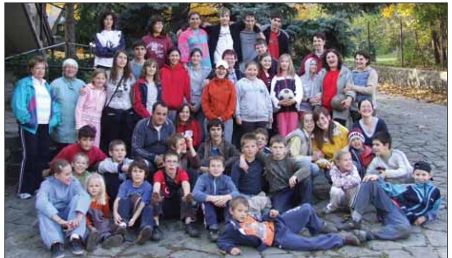
A KIFI őszi szünetben szervezett táborában játékosan és tartalmasan telt az idő