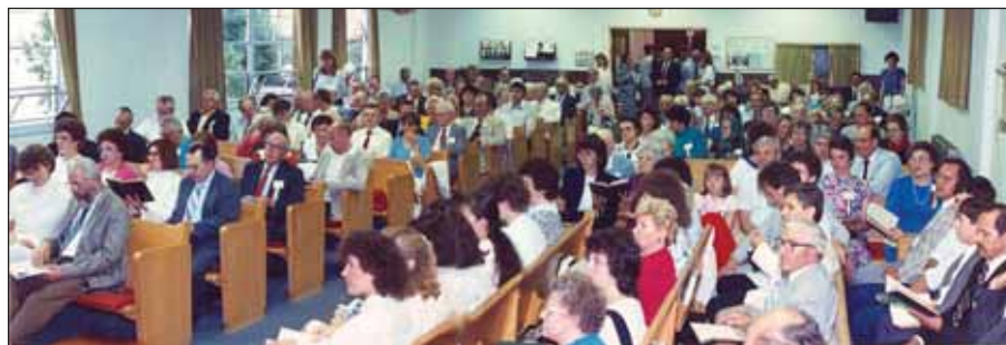
Az 1990-ben egyesített szövetségi közgyűlés résztvevői a Clevelandi Magyar Bethánia Baptista Gyülekezet imaházában

Az amerikai magyar baptisták között 1980-ban nyelvi, szervezeti nézetkülönbségek, valamint az óhazával való kapcsolattartás különböző megítélése miatt közel tíz évig tartó szakadás következett be. Mivel az Evangéliumi Hírnök ebben az időben egyre kritikusabb hangvételű és többségében angol nyelvű cikkeket közölt, szükségesnek tűnt egy magyar nyelvű evangéliumi lap indítása A Küirt címmel. Nem volt könnyű feladat azokban az időkben a megszakadt testvéri kapcsolatok helyreállítása, a két szövetség megbékítése, valamint a két magyar alapítású lap egyesítése, amely éppen a Clevelandben töltött lelkipásztori szolgálati éveim időszakára esett. A két szövetség ünnepélyes egyesítő közgyűlését 1990 nyarán, az akkor újonnan vásárolt clevelandi imaházban tartottuk meg. Erre a jelentős eseményre, aminek az előkészítésében és lebonyolításában magam is tevékenyen részt vettem, immár 20 éve, Amerikából való hazatérésünk előtt került sor.