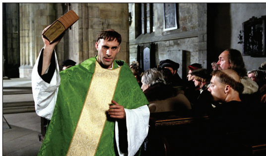
Luther Márton reformátor a wittenbergi templomban (filmjelenet)

Itt van az ősz, itt van újra – hűvös éjszakáival, szél sodorta faleveleivel, elmúlt idézõn. Egykoron Pál is átérezte ezt a római börtönben. Ezért írt így fiatal tanítványának, Timóteusnak: „Igyekez a tél beállta előtt megjönni!” „Köpenyemet... hozd el... hozd el a könyveket is, de fõként a pergameneket!” (2Tim 4,21. és 13. v.) (folytatás az utolsó oldalon)