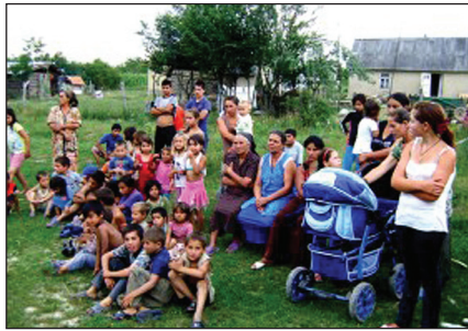
Beregújfalun júliusban megindult a romamisszió egyelőre egy tíres telken

Mint bizonyára tudjátok, június elsején visszaérkeztünk Kárpátaljára. Mindjárt belecsoportunk a sok tennivaló közepébe. Először elmentünk Kijevbe az IMB éves találkozójára, ami majdnem egy hétig tartott.