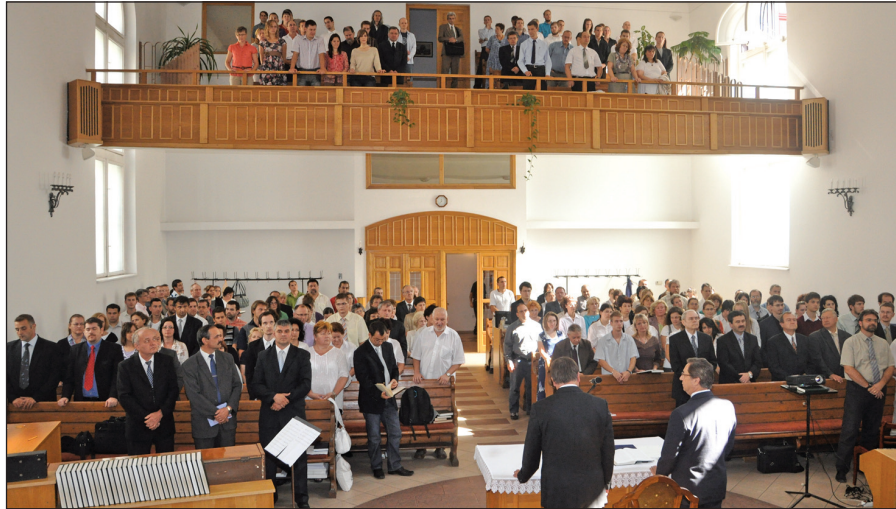
A Baptista Teológiai Akadémia szeptember 17-én tartotta tanévnyitó istentiszteletét a történelmi múltú Wesselényi utcai imaházban.