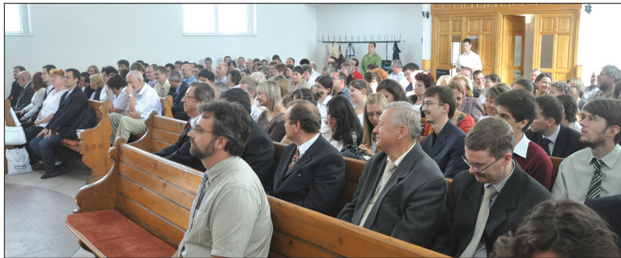
Jókedvvel készülnek az új tanévre oktatók és diákok egyaránt.