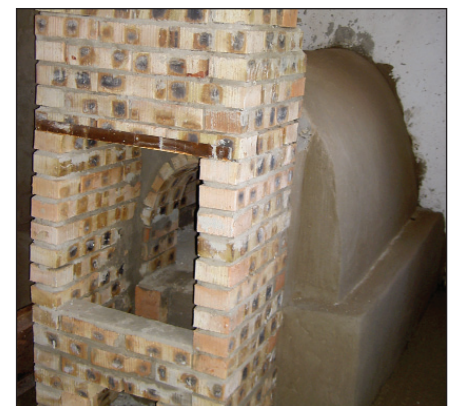
A szakszerűen megépített kemence