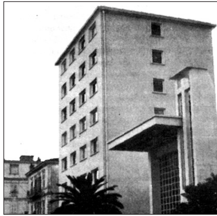
A monte-carlói evangéliumi rádió központi épülete

Ez alkalommal Sámuelhez hasonlóan lélekben mi is leteszünk egy követ, és Ében-Háézernek nevezzük el, mert: Mindeddig megsegített bennünket az Úr. Igen, mi mindnyájan, akik Magyarországon és külföldön ebben a szent munkában részt vettünk, az Úrnak adjuk a dicsőséget azért, amit vele és általa el tudtunk végezni.