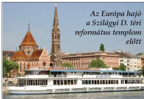
Az Európa hajó a Szilágyi D. téri református templom előtt