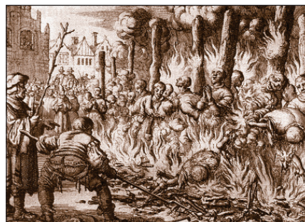
18 anabaptista máglyahalála 1528-ban Salzburgban

Falkenstein/Sólyomkővár a hajdani Felső-Magyarország (ma Szlovákia), Morvaország (ma Csehország) és Ausztria hármashatárának közelében található település, Bécstől északra mintegy 60 km-re. Valamikor a reformációt követő évtizedekben ez a vidék szolgált menedékkül a Svájcól, Dél-Németországból és az ausztriai Tirolból elűzött anabaptisták számára. Az osztrák határ túloldalán található morvaországi (ma Csehországhoz tartozó) Nikolsburg/Mikulov valamikor a mintegy 70 ezres anabaptista menekültáradat szellemi központjává vált. Korának legismertebb anabaptista reformátora, dr. Hubmayer Baltazár ebben a városban telepedett le ideiglenesen több ezer hívével együtt, és irányította a környék településein