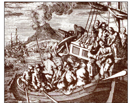
Magyar gályarabok az Adrián

Hubmayer híveivel együtt a huszita ébredés hazájában, Morvaországban keresett védelmet a fokozódó üldözés miatt. Eredményes munkásságát jelzi, hogy igehirdetésére az ország egyik legismertebb főnemese, Nikolsburg városának egyházi főméltósága, Liechtenstein Lénárd örgróf is megtért, akit Hubmayer részesített hitvalló keresztiségben. Igazán ennek köszönhető, hogy az anabaptisták egy ideig az örgrófság területén szabadon élhettek. Hubmayer anabap-