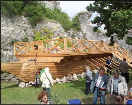
A vár kapubejáratánál egy élethű tengeri gálya

ző kézműves szakmák köré tömörülve. Ennek az anabaptista mozgalomnak Észak-Magyarországra (Felvidék) és Erdélybe letelepedett ágát hívták hazánkban „hutterita” vagy „habán”, illetve „újkeresztyén” testvéri mozgalomnak.