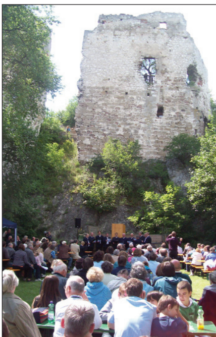
Ünnepi istentisztelet Falkenstein/Sólyomkővár udvarán

I. Ferdinánd kegyetlen üldözésének újabb hulláma 1539/1540 fordulóján erősödött fel ismét az anabaptisták ellen. Megállíthatatlan létszám-növekedésüket irgalmatlan megtorló akciókkal kívánta megfékezni. Így történt, hogy 1539. december 6-án a fenn említett morva-magyar-osztrák határ környékén élő mintegy 150 anabaptista testvért tartóztatott le és záratott Falkenstein/Sólyomkő várának sötét várbörtönébe. Majd hosszabb fogság után az asszonyokat és gyermekeiket elengedve mintegy 90 vezető anabaptista személyt ítélte gályarabságra. A férfiakat egymáshoz láncolva indította, katonai őrizet mellett, gyalogosan a magyar-osztrák határ mentén az Adria-parti kikötő-