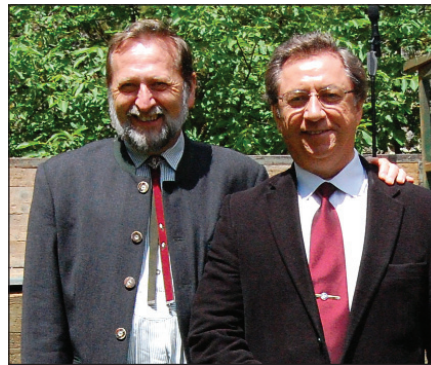
A cikk írója Josef F. Enzerberger bécsi egyházttörténész professzor társaságában

Erre az eseményre emlékeztünk Falkenstein/Sólyomkővár udvarán ünnepi istentisztelet keretében ezen a vasárnapon. A vár épen maradt helyiségeiben egy többfunkciós, interaktív múzeum is nyílt az anabaptista gályarabok emlékére, akik között a megtalált dokumentumok adatai szerint magyarok is voltak. Ezt bizonyítja a kiállítás egyik táblója, melyen az „Ungarische Pastoren”