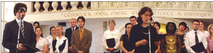
A végzős hallgatók csoportja

Akadémiánk rektora köszöntötte a 60, 50, 40, és 25 éve végzett jubiláló testvéreket, a hálaadás szavát Győri Kornél lelkipásztor, teológiánk nyugalmazott tanára mondta el a jellemformáló, jó alapot adó teológiai éveikért.