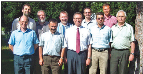
A szlovákiai és magyarországi baptista vezetők

A Szlovákiai Baptista Szövetség elnöksége meghívására 2011. június 8-án Pozsonyban találkoztak a magyarországi és szlovákiai baptisták vezetői. Örülünk annak, hogy a már szinte hagyományosnak mondható baráti és testvéri viszonyt nem zavarja meg a napi politika feszültségkeltő szándéka. Valljuk, hogy Krisztusban nincs szlovák és nincs magyar, benne való hitünk egységet teremt közöttünk.