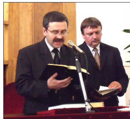
Az istentisztelet szolgálattevői