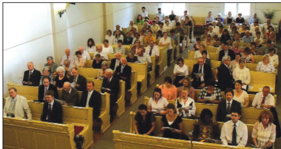
Az ünneplő gyülekezet egy része

saiktól, tanáraiktól, mint amire számíthattak volna, közösségben, imádságban, személyes tanácsolásban, odafigyelésben. (folytatás a következő oldalon)