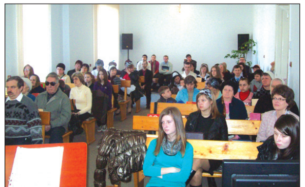
A beregszászi gyülekezet figyelmes igehallgatói