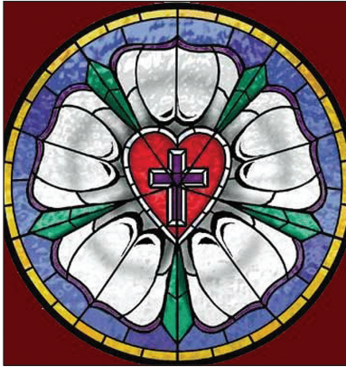
Luther-rózsza – az evangélikusok nemzetközi szimbóluma