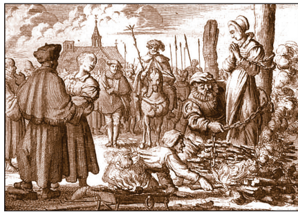
Máglyahalálra ítélt anabaptista asszonyok Németországban, akik nem engedték csecsemőiket hit nélkül megkereszteltetni

A Magyar Királyság felvidéki területein 1546-tól tömegesen letelepedett, az Erdélyi Fejedelemség területére pedig 1621-től áttelepített anabaptistákat „ újkeresztényeknek ” vagy „ testvéreknek ” nevezték. Máshol a gazdasági összefogásuk egyik jellegzetes iparága, a speciális kerámiakészítés mesterei szintű művelésében is jártas anabaptistákat a német eredetű „ habán ” jelzővel illették. A sok üldözéssel és megalázó számkivetéssel kísért „ újkeresztény-habán ” közösségek 1763-ban hagyták el végleg hazánk területét Mária Terézia (1717–1780) habsburg császárnőnek az anabaptistákat halálos fenyegetéssel sújtó kegyetlen törvényrendelete nyomán. Útjuk ezután Ukrajnán keresztül Oroszországba, majd később Amerikába vezetett.