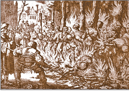
Tömeges tűzhalálra ítélt anabaptisták

Az anabaptisták mozgalmát irgalmatlanul elítélő korabeli reformátori nyilatkozatok, majd a lutheránus fejedelmek által kezdeményezett és 1529-ben Speyerben összeülő birodalmi gyűlésen szentesített, így államilag törvényesített tömeges kivégzések és évszázadokig tartó kegyetlen üldöztetések ismeretében értjük meg igazán az evangélikus/lutheránus világegyház mostani bocsánatkérésének történelmi jelentőségét.