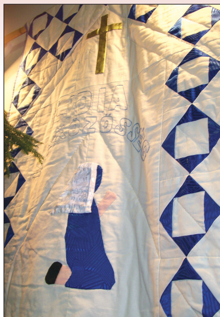
Olasz Lászlóné munkája