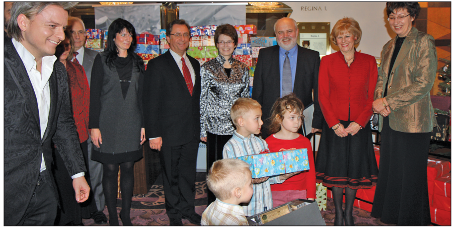
Schmitt Pálné Makray Katalin, a köztársasági elnök felesége (jobbról a második) a Magyarországi Baptista Egyház és a Baptista Szeretetszolgálat vezetőivel

Országszerte baptista gyülekezetek, művelődési házak, üzletek és iskolai közösségek vállalták, hogy ügyeleti rendjükben fogadják a cipősdobozba zárt ajándékokat. Így az akció végére 22 450 dobozt sikerült összegyűjtenünk, amelyeket számtalan ünnepi ceremónián osztottunk ki rászoruló, kórházban kezelt, nevelőszülőnél vagy otthonban nevelkedő gyermekek számára. A fővárosban a X. kerületi Pataky Művelődési Házban szerveztünk két előadást, amelyek során 800 gyermeknek adhattunk át ajándékot.