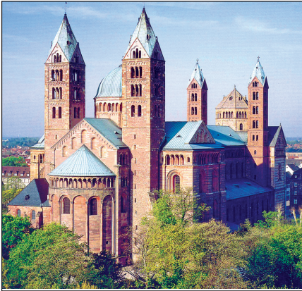
A speyeri székesegyház, ahol a katolikus és lutheránus fejedelmek 1529-ben birodalmi törvényt hoztak az anabaptisták fizikai megsemmisítése ügyében

Ahhoz, hogy Luther az addig elért reformokat megvédje, 1525 áprilisától az erőszak közéhez nyúlt. A hozzá hű német fejedelmek katonai beavatkozását kérte a forradalmi megmozdulások fegyveres leverésére. Luther fő ellenfele a radikális társadalmi változásokat sürgető Münzer Tamás volt, aki egyébként a közhiedelemmel ellentétben sohasem vált anabaptistává. (Szerepe nem volt több, mint Dózsa György keresztes hadvezéré, aki tíz évvel korábban, 1514-ben a Magyarországon kibontakozott parasztfelkelés élére állt.) Az viszont tény, hogy Münzer valóban nyílt fegyveres ellenállásra buzdította a mélyszegénységben élő elnyomott, sorsával elégedetlen német parasztságot.