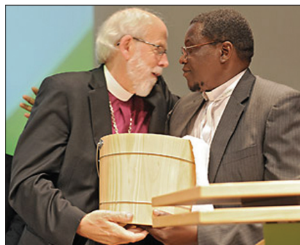
A megbékélés pillanatai