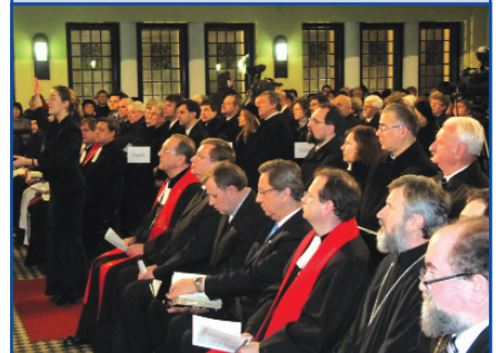
Az országos megnyitó istentisztelet szolgálattevői